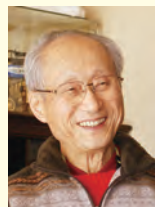
愛知県 / Aさん

トビラフォンを付けてからは、予約の連絡や取引先からの必要な電話以外は自動的に拒否してくれるので、より施術に集中できるようになり非常に満足しています。